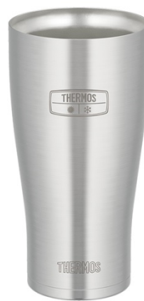
JDE-600 S: ステンレス