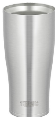
JDE-420 S: ステンレス