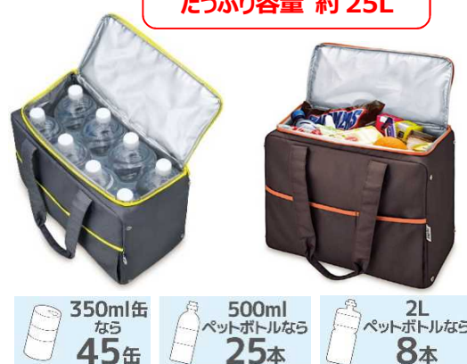
GY : グレー