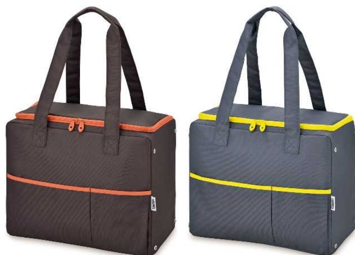
BW : ブラウン