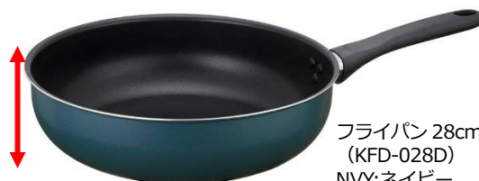
フライパン 28cm (KFD-028D) NVY:ネイビー