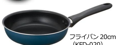
フライパン 20cm (KFD-020) NVY:ネイビー