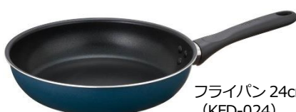
フライパン 24cm (KFD-024) NVY:ネイビー