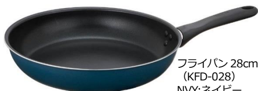
フライパン 28cm (KFD-028) NVY:ネイビー