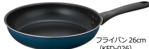
フライパン 26cm (KFD-026) NVY:ネイビー