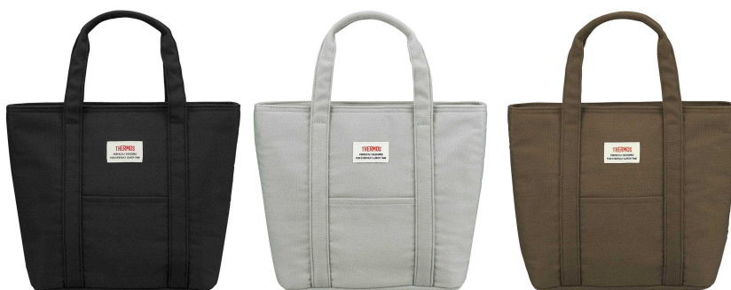
左から BK：ブラック、GY：グレー、BW：ブラウン