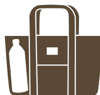
500ml のペットボトルを 立てて入れられる