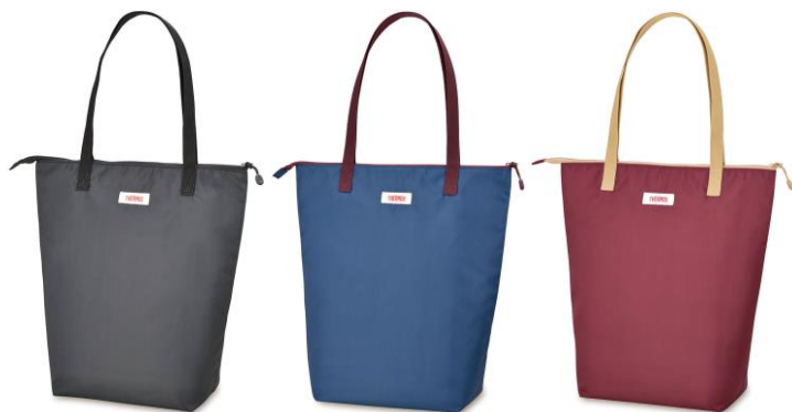
DGY : ダークグレー