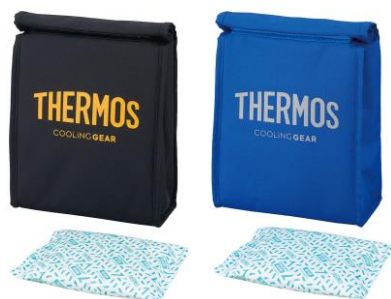
左から) BKOR : ブラックオレンジ、BLSL : ブルーシルバー