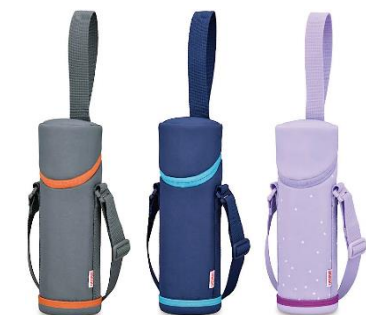
APG-501 左から GY-OR:グレーオレンジ、 NVY:ネイビー、PL-ST:パープルスター