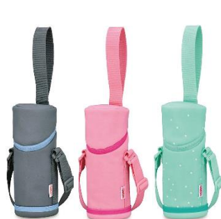
APG-351 左から GY-BL:グレーブルー、 P:ピンク、MT-ST:ミントスター

※詳細は、別途配信の『サーモス 真空断熱ケータイマグ（JNL-352/502/602/752）』のリリースをご確認ください。