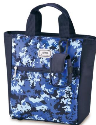
NV-C：ネイビーカモフラージュ