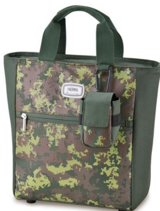
KK-C：カーキカモフラージュ