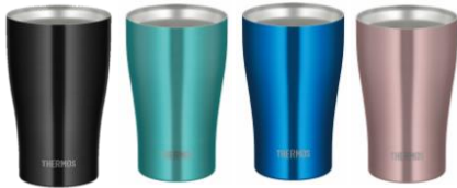
JDY-340C 左から BK: ブラック、MNT: ミント、 OBL: オーシャンブルー、CAC: カカオ