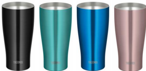
JDY-600C 左から BK: ブラック、MNT: ミント、 OBL: オーシャンブルー、CAC: カカオ