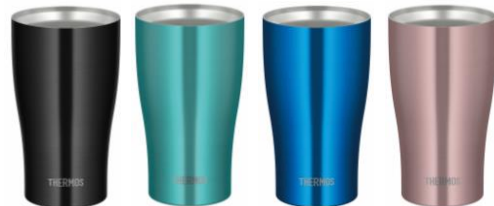
JDY-420C 左から BK: ブラック、MNT: ミント、 OBL: オーシャンブルー、CAC: カカオ