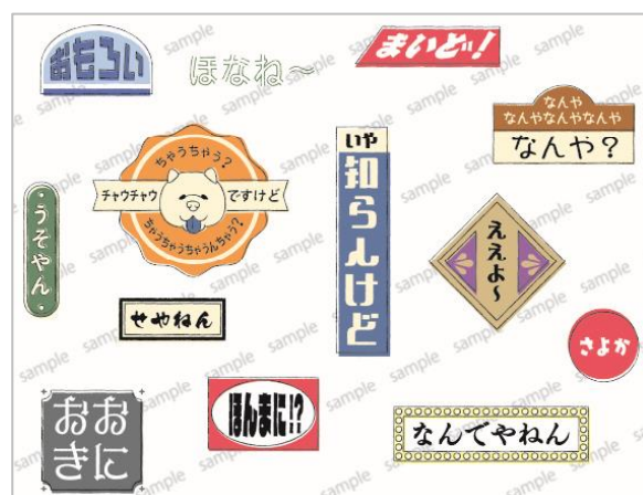
覚えて使って！ 関西弁デザイン

「ご当地ボトル あなたはどっち!」キャンペーン結果サイト( https://www.club-thermos.jp/tm-vote/show?page=result2 )