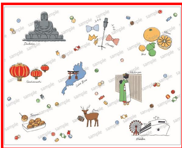
ええとこいろいろ！ 関西名物デザイン

「ご当地ボトル あなたはどっち？」キャンペーン 第二弾 関西 投票結果 投票期間：2024年11月22日（金）～12月23日（月）