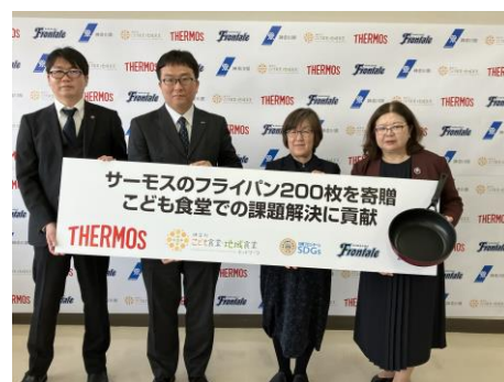
「神奈川こども食堂・地域食堂ネットワーク」フライパン贈呈式の様子（2025 年）