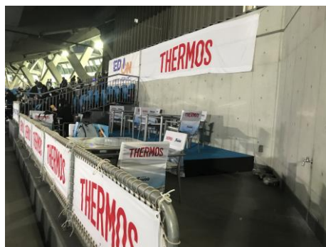
サーモス パーティーシート