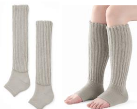
③リラックスリブであったかレッグウォーマー ロング丈 (AL-C503F)