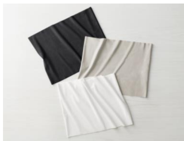
⑤微起毛あったかハラマキ (AC-C501B)

シリーズの中でも人気の高い「微起毛あったかハラマキ」に、透けにくく自然な色味にこだわった新色のライトグレーが加わります。さらに、ゆとりのある着用感を求める方や、男性のお客様からのご要望を受け、「ゆったりサイズ」も新たに発売します。