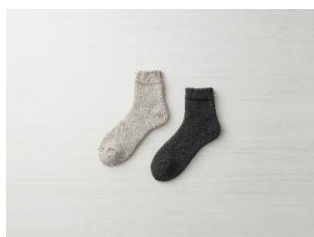
②起毛であったかルームソックス ショート丈 (AL-C502B)