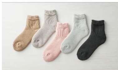
①起毛であったかルームソックス ショート丈 (AL-C502G)