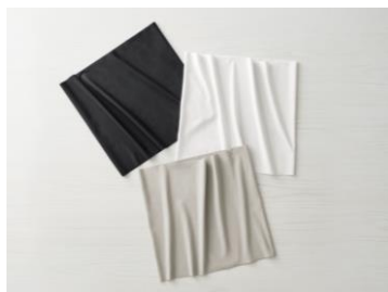
⑥微起毛あったかハラマキ (AC-C402G)