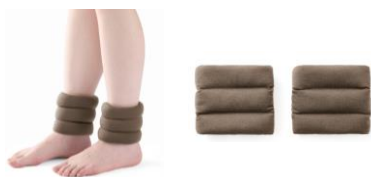
④足首あったかビーズウォーマー (AN-C501F)