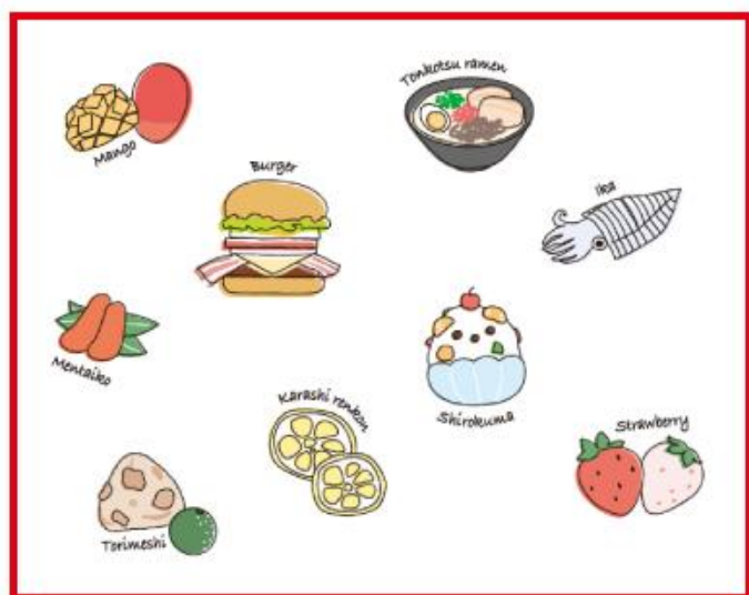
九州が誇る、バラエティに富んだ食文化! グルメデザイン