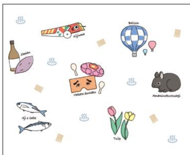
芸能からイベントまで、楽しいことがいっぱい! 名物デザイン