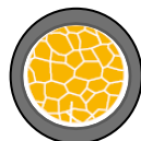
ビーズウォーマー 断面イメージ