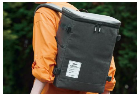
『保冷バックパック（RFP-025）』

今回、さらなる利用シーンの拡大と、酷暑中でも日々の買い物を快適にさせていただくことを目的に、だれもが“シーンを選ばず使える”デザインを検討を進めました。また、当社ソフトクーラー利用者へのアンケートでは、「両手が空き、子ども連れやベビーカー利用時にも使いやすいものが欲しい」などの声が寄せられていたことから、これらのニーズに応えるべく、“保冷できるバックパック”の開発に着手しました。従来の「保冷バッグ」とは異なるデザインで、より生活に溶け込むデザイン性が特長です。