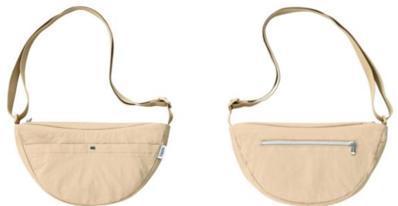
フロントポケット付き