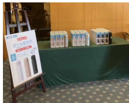
▲昨年の贈呈ボトル受け渡しカウンターの様子

サーモスは、スポーツ時には5℃～15℃の水分を補給することが効果的であるという情報を発信し（※）、夏場の高い気温の中でプレーする選手やキャディーの方々に、会場を訪れるギャラリーの皆様にも、適した温度帯の飲みものによる水分補給をしていただくことを目的に、「ヨネックスレディスゴルフトーナメント」に協賛しています。飲みものの温度を5℃～15℃に長時間キープできるマイボトルを活用した熱中症対策の普及を目指し、昨年に続き2026年もボトル贈呈および抽選会を実施します。