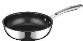
AFFA-020 S: ステンレス

磨き上げられたステンレスの鏡面に映る光のラインが美しいフライパンのシリーズです。