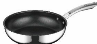
AFFA-026 S: ステンレス