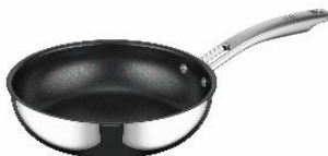
AFFA-024 S: ステンレス