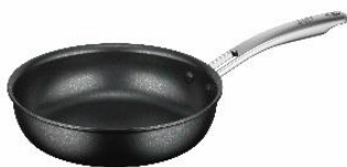
AFFB-024 BK: ブラック