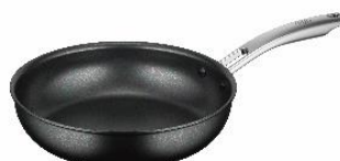
AFFB-026 BK: ブラック