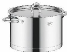
AFNA-020WD S: ステンレス