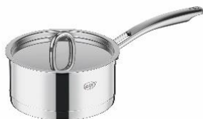
AFNA-016S S: ステンレス

底部分はアルミをステンレスで挟んだ3層構造で、熱ムラが少なく、無水調理や無油調理にも適しています。