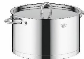
AFNA-024WD S: ステンレス