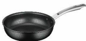
AFFB-020 BK: ブラック

STRAHL の軽量タイプのフライパンシリーズ。深型ながら軽くて使いやすいのが特長です。