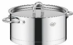
AFNA-020W S: ステンレス