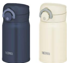
JOP-250 左から DPNV:ディープネイビー、NW:ナチュラルホワイト