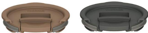
JDS Lid (M)