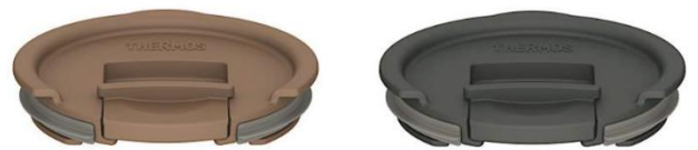
JDS Lid (L)