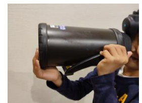
実際の使用方法 (前モデル：FFV-2001)

大容量のスポーツジャグは、スポーツシーンにおいて幅広い年代の方に使用いただいております。小学校低学年から使用されている方もいらっしゃいます。しかし、水分補給の際その重さを支えきれないことから、 当社の想定とは異なる持ち方 (飲み方) をしているお子様の様子が見られました 。そこでデザイン性を維持しながら、小学校低学年でも使いやすいハンドル形状を模索。お子様のモニターにも協力してもらいながら、新構造「ラク持ちハンドル」を開発しました。