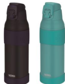
FJR-1000 左から MDB:ミッドナイトブルー、 TQS:ターコイズ