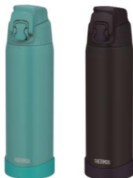
FJR-720 左から MDB:ミッドナイトブルー、 TQS:ターコイズ