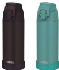
FJR-500 左から MDB:ミッドナイトブルー、 TQS:ターコイズ