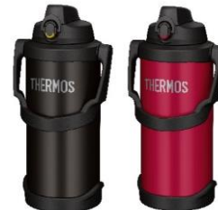
FJQ-3000 左から BK:ブラック、R:レッド