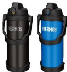
FJQ-2500 左から BK:ブラック、BL:ブルー