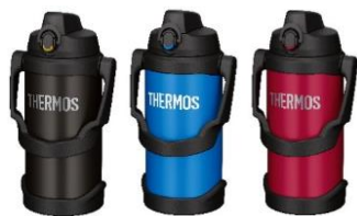
FJQ-2000 左から BK:ブラック、BL:ブルー、 R:レッド