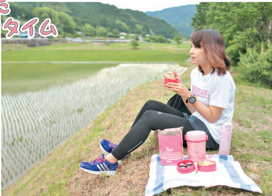
滑床溪谷手前の田園風景。田植えが終わったばかりの水田の緑が眩しい。

宇和島エリアは、日本の原風景のような場所が数多く存在する魅力的な地だ。ちょっと山間部にクルマを走らせれば、日本昔話に出てきそうな山々と、のどかな田園風景が広がる。海沿いに行けば昔ながらの雰囲気の色濃く残した漁港もある。キャニオニングやサイクリングといったアクティビティーを満喫したら、そんな絶景の中でひと休み。これまた旅先での贅沢な時間だ。