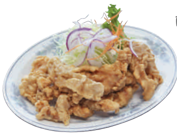
レストラン東洋軒 住別府市石垣東7-8-22 ☎0977(23)3333

鳥てんの発祥の地は大分。しかもこのレストラン東洋軒が、元祖なんだとか。水を使わず卵のみで揚げているので、冷えてもフワフワ食感。かばす酢醤油につけていただく。全国に発送可。