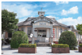
大正ロマン館 〒兵庫県篠山市北新町97 ☎079(552)6668