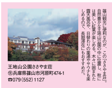
王地山公園ささやま荘 〒兵庫県篠山市河原町474-1 ☎079(552)1127

篠山観光に便利なのが、この「ささやま荘」。自然豊かな王地山公園の中に位置し、秋には美しい紅葉が楽しめる。木々に囲まれた露天風呂や、日替わりの薬湯やサウナも楽しめるので、長期滞在にもおすすめです。